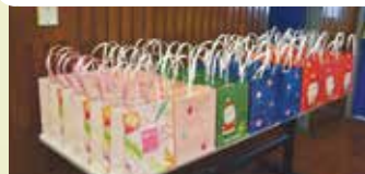
校長贈送小禮物予中六同學