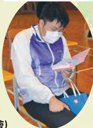
中六同學感受一絲絲的暖意

中六同學即將面對香港中學文憑考試，我們特為中六同學舉辦文憑試誓師大會，為中六同學打下強心針。過程中校長向各位同學作出勉勵，並贈送親手寫的鼓勵卡及小禮物，以鼓勵中六同學。老師們亦分享自己公開試應試經歷及拍攝加油影片，而就讀大學的校友亦分享備試及升學心得，希望激勵中六同學努力溫習。