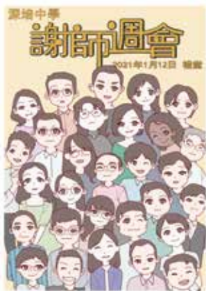
中六同學設計的謝師周會程序表封面

中六級同學為了答謝深培師長多年來的教導及關懷，全級同學特意共同預備一個周會，並透過直播系統令全校老師同時間都能觀賞。部份中六同學負責設計程序表及感謝卡，並把感謝卡送給師長；其他同學則透過各類表演環節，如舞蹈、話劇、唱歌及演說，以表達對校長、老師、工友等職員的謝意，希望令師長們感到他們真摯的心意！