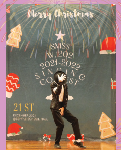
參賽同學勁歌熱舞，天才橫溢