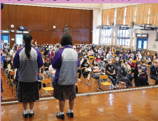
同學樂於服務，勇於挑戰，擔任家長教師座談會司儀

為增進家長與老師間的溝通，藉此提高學校的教育質素，我們舉行了家長教師座談會，盼透過與班主任會晤，使家長了解同學在校內的學習情況，共同商討如何速進同學的學習及成長。