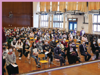
家長們關心子女成長，踴躍出席