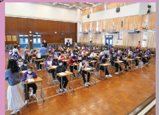
中一同學專心聆聽講者講解，用心學習