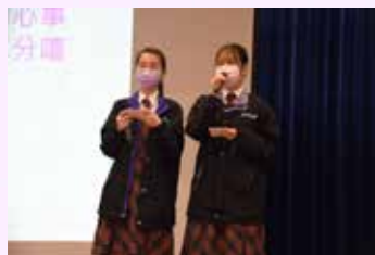
同學代表領唱詩歌