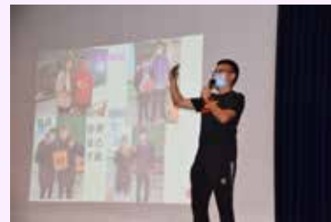
班主任分享同學在學校的成長片段