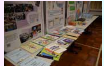
現場提供考試及升學資訊給予同學參考