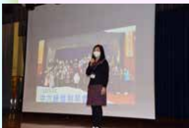
黃校長為中六同學送上祝福

學校在中六級同學最後的正式上課日舉行了中六惜別早會，讓同學和老師共同回顧過去六年在深培的校園生活。同學藉著活動互相打氣，校長和老師亦對同學作出勉勵以及送上加力包和小禮物，希望為同學打打氣，給予祝福。中六級同學，你們即將要邁向更加遼闊的新征程，一路上會面對更多的艱難挑戰，但請謹記要勇敢向前，走出屬於自己的路。