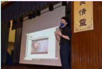
老師分享應試心得

為了提升學習氛圍，幫助中六同學面對即將來臨的香港中學文憑考試，我們為中六同學安排了一連五天的溫習營。每天設有不同溫習主題，幫助同學好好準備公開考試。溫習營在禮堂舉行，我們把禮堂佈置成一個安靜舒適的環境，讓同學更安心地溫習。各科任老師亦輪流到場提供學習上的支援，並向各位中六同學送上小冊子，當中集合了老師們的應試心得以作參考，希望同學從中有所得著，並能以最佳狀態作最後衝刺。