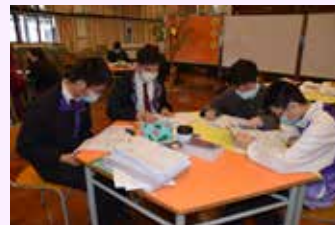
中六同學為公開試認真準備