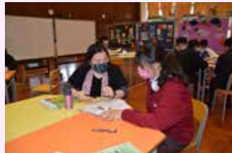
各科老師到場為同學提供支援